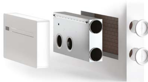
Soloclim muni d'un kit lateral.