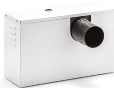
SCBR3 Zerstäuber Soloclim

SCBR3 wird über die Ablassleitung für Kondensat des Soloclim versorgt. Dieses wird zerstäubt, verdampft und dank des innovativen Systems mit piezoelektrischen Zellen ausgestoßen. SCBR3 kann sowohl innen (mit Wandbohrung 80 mm) als auch außen installiert werden.