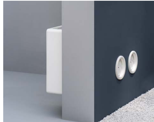
Darstellung Wandmontage mit den zwei Wanddurchführung und Aussenwandklappen, Optional erforderliche Wanddurchführung für Kondensatabläufe.

Soloclim kann an jeder geraden Wand installiert werden, in Fuß- oder Kopfhöhe. Alle Teile die für die Installation benötigt werden (Schrauben, Bohrschablone, Abdeckklappen, Rohrpappen) sind im Lieferumfang inbegriffen. Ein optionales Wandeinbaukit ermöglicht es, eine um 90° versetzten Ausblasrichtung zur Aussenwand zu realisieren. Bei hoher Montage sollte eine Unterseitenabdeckung verwendet werden. Eine Bohrmaschine ist das einzige, was separat für die Installation benötigt wird.